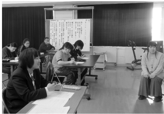
（卒業生の今は？）仕事&くらし&人間関係を聞いてみました。