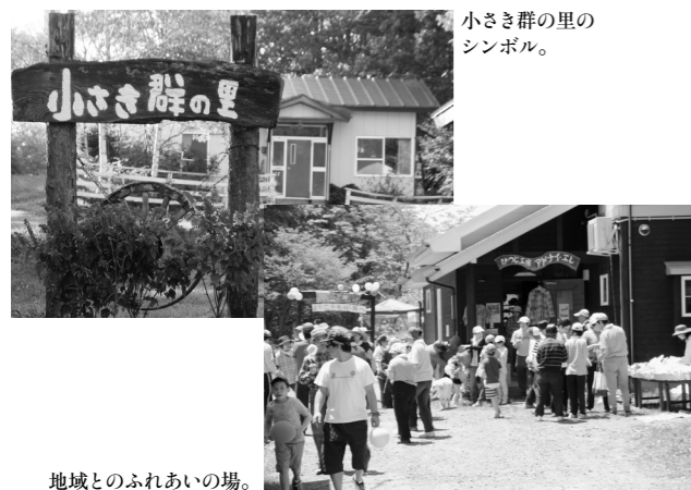
小さな群の里のシンボル。

奥中山は、人口約3000人の地域である。この地で生まれ育った私が、小学校5年生になった1973年4月にカナン園の最初の施設である奥中山学園が開園した。以来丸46年経つ現在まで、この地に住み続け、地域住民というだけではなく、仕事としてこの地とカナン園との関わりの一端を担ってきた。