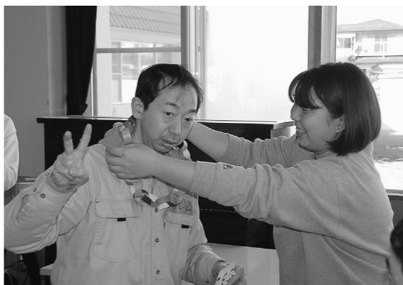
見事に「ビンゴ!」。手作りの首飾りのプレゼントを贈りました。

紙コップ積みの際には、各グループの個性溢れた作品が多く、完成したものをみんなで見せ合うことがとても楽しかったです。