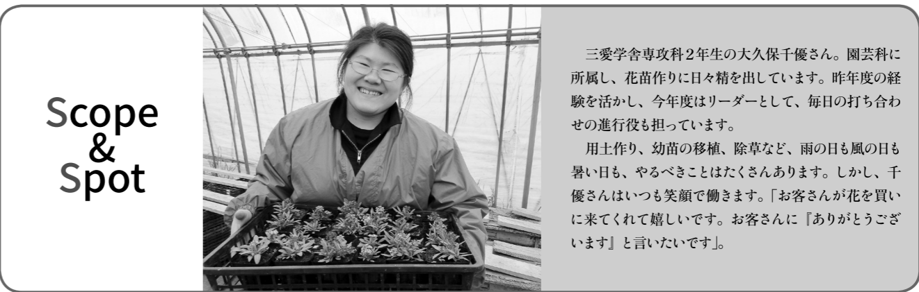
●機関誌「カナンの園」では、読者の皆さまからの声もお待ちしております。機関誌カナンの園に対するご意見、ご感想を、事務局までお寄せ下さい。

他方、この間、社会情勢も大きく変容してきました。様々な尺度で人と人の間に線が引かれ、様々な理由で社会的弱者が生み出されてきています。その中で、カナンの園には、障がいのある方々と共に培ってきたものを活かし、すべての人が社会の構成員として孤立することがなく、また排除されることのない包括的な社会をめざすことが求められています。 新しく与えられた小さき群の里事業所の建物が、各事業所が、そしてカナンの園に関わる一人ひとりがそのような働きを与えられていることを胸に刻みながら、次の一歩を踏み出そうとしています。皆さまのお交わり、そしてご支援が大きな力になっています。 （佐藤真名）