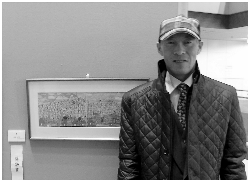
受賞作を前に記念写真。

となんカナンに通い始めて、1年数カ月が経ちます。当初はなかなか出勤できず、「仕事」という言葉に敏感で、となんカナンが安心して通える場所であることを感じるまで時間がかかったのだと思います。