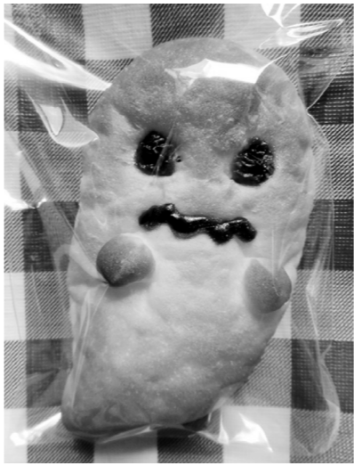
限定パン第1号「おぼけパン」。

との会話をきっかけにカナン牧場内の販売促進委員会で検討を始めた。限定パンを通して、従業員がより主体的にパン製造に関わり、スキルアップや仕事へのモチベーション、達成感に繋がることを願って、またイベント感や季節感があり、