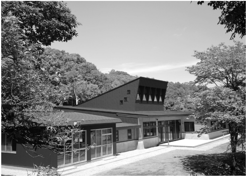
自然豊かな景観の中に力強く建つ新事業所。

法人建設委員会は33回、工程会議は43回に及びました。昨年8月の定礎式を以て工事が開始され、記録的な降雪という厳しい自然環境の中、工事に携わるすべての方々の士気は下がることなく、一人ひとりの高い技術と丁寧な仕事で建物が創り上げられていきました。利用するすべての方々が