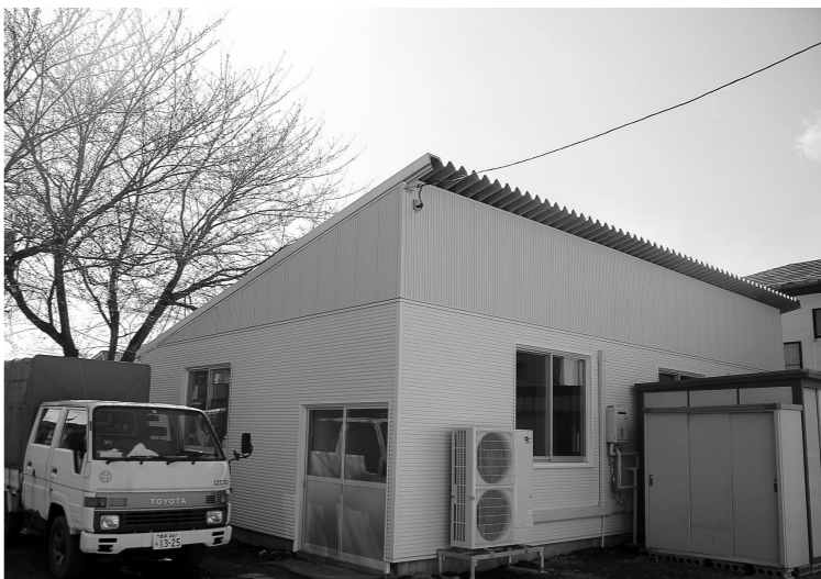
新しくなった作業棟。プレハブの建物が外観も内部も見違えるように生まれ変わりました。

これまでの石けん作業棟は、冬はストーブを焚いても室内は氷点下。作業中ははかじかみ、足先がジンジン冷えてくる。逆に夏は「午後は暑すぎて危険！」と、