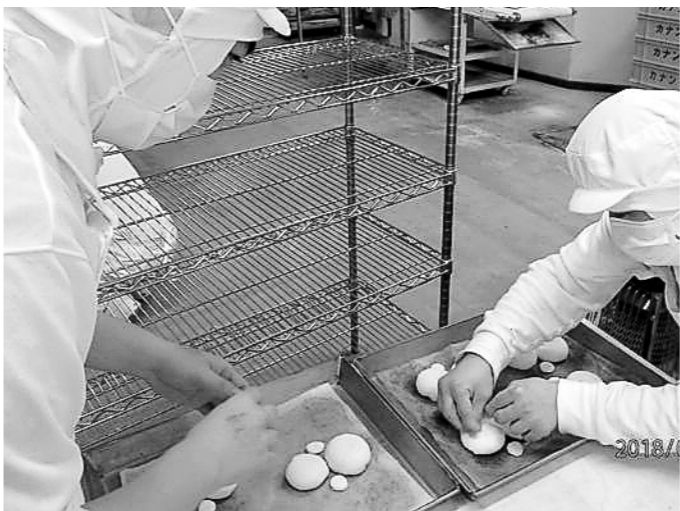
ゆきだるまパン製作中。

「物語のあるパン屋」のカナン牧場に、今日も新たな物語を加え、これからもみんなで手を取り合い、限定パンのコンセプトでもある「遊び心」も