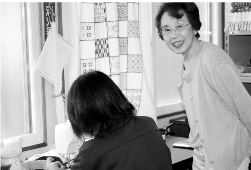
「生徒の皆さんから元気をもらっています。」

三愛学舎で活動していると、教えているつもりが、私の方が教えられていると感じることがたくさんあります。生徒の皆さんはたくさん卒業しましたが、私は卒