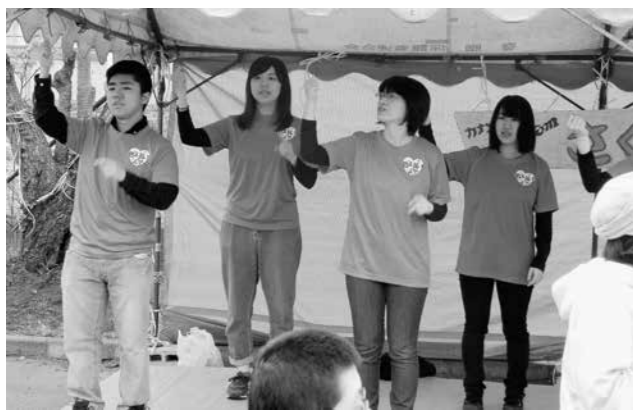
メンバー一同、楽しい一日となりました。