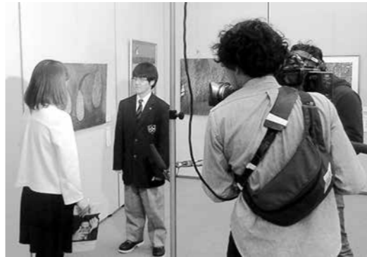
緊張しながら取材を受けました。

注…きらら大賞は、2017年3月に開催された第20回いわて・きららアート・コレクションの最高賞です。