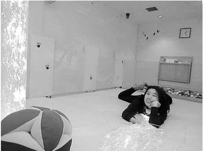
みんなリラックスできる空間が大好きです。

私たちにとっては、顔なじみになった利用者の方々のチョットした会話も、毎回の楽しみです。