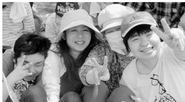
奥中山小学校の運動会に来てま〜す。

ことなど一つもないです。どんなに一生懸命に関わってもいいんです」と話されていたことを思い出します。私たちは仕事や資格では計れない繋がりの中で、今日も互いの人生が豊かにされる互酬性(＝互恵性)の中に生かされている。その恵みに留まることもまた、私たちが継承すべきことのひとつです。