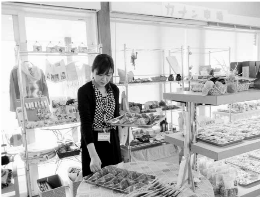
製品の温もりをお客さまへ届けたい…。