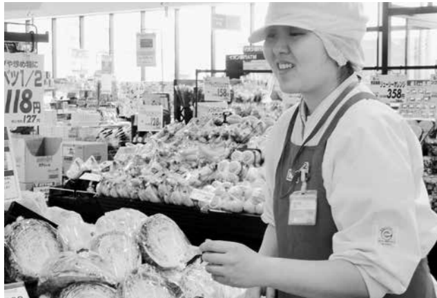
楽しく働いています。