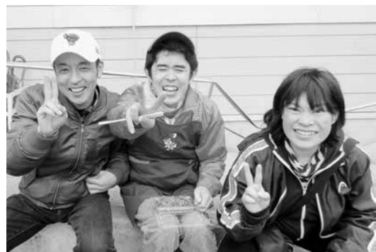
さくら市だぜ! イエーイ!!

激しく変容していく福祉施策の中で、カナンの園においても創始期を担ってきた方々が次々と退職し、世代交代となりました。ある人が「初代の時は、美味しくてみんなが集まったラーメン屋でも、二代目になると味が違って店が傾くことがある」とチクリと釘を刺しました。どれほど、制度やサービスが充実してもツル