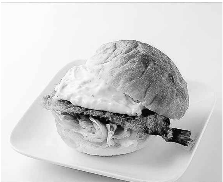
東北自動車道「岩手山サービスエリア（下り線）」名物男鹿ハタハタバーガー。「ご当地変わり種」バーガー10選にも選ばれました！